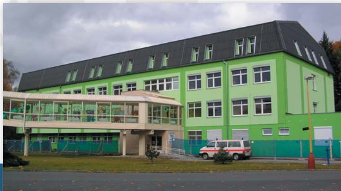
Zrekonstruovaný pavilon s dětským oddělením

Oddělení přijímá k hospitalizaci pacienty od narození do dovršení 19 let věku se všemi diagnózami, včetně operačních a úrazových.