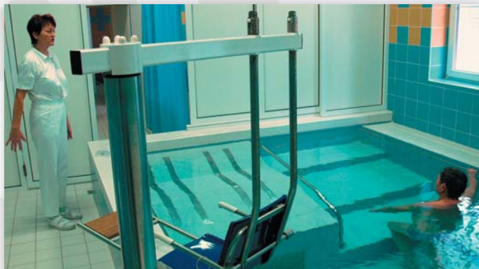
Léčebný tělocvik v bazénu

Je nelůžkovým zařízením určeným k poskytování ambulantní formy rehabilitace. Personálně zajišťuje také rehabilitaci pacientů lůžkových složek nemocnice dle ordinací lékařů. Metodicky vede zdravotní sestry, které provádějí rehabilitační ošetřovatelství na odloučených pracovištích. Jedna fyzioterapeutka pravidelně dochází provádět individuální léčebnou tělesnou výchovu do speciální mateřské školy.