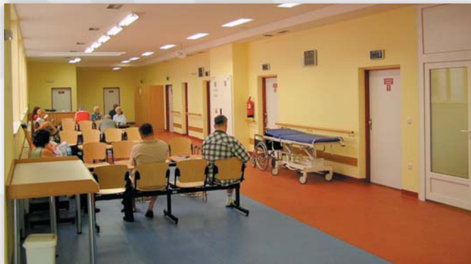
Čekárna ambulantního traktu

Na úseku centrálního příjmu je pacient po registraci na recepci odeslán na příslušnou odbornou ambulanci (chirurgická, ortopedická, jiná specializovaná) k vyšetření či ošetření. V případě nutnosti hospitalizace je základní administrativní i vstupní vyšetření provedeno na úseku plánovaného příjmu. Za rok 2009 bylo v rámci centrálního příjmu ošetřeno téměř 39 tisíc pacientů. V uvedených prostorách je rovněž zajišťována lékařská služba první pomoci (LSPP).