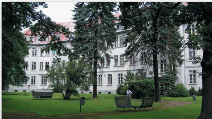
Nemocnice Město Albrechtice

V přízemí je situován ambulantní úsek, kde SZZ provozuje RDG pracoviště, ortopedickou a urologickou ambulanci, dále je zde k dispozici také ambulance interní, gynekologická i stomatologická včetně RTG.