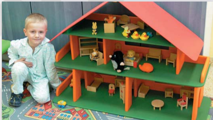
Sponzorský dar pro děti – hrací domeček