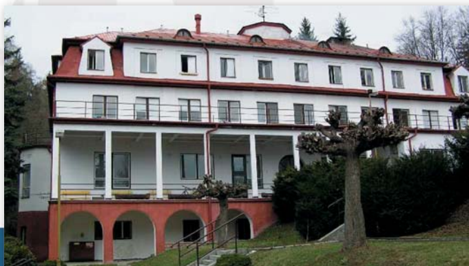
Lékárna TRN Ježník