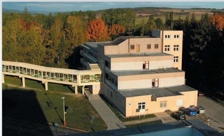
Pavilon s dětským oddělením PŘED ▶ rekonstrukcí (9/2009)