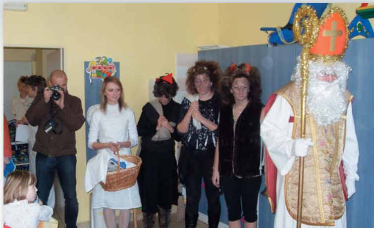
Mikulášská nadílka na dětském oddělení (prosinec 2009) ▶