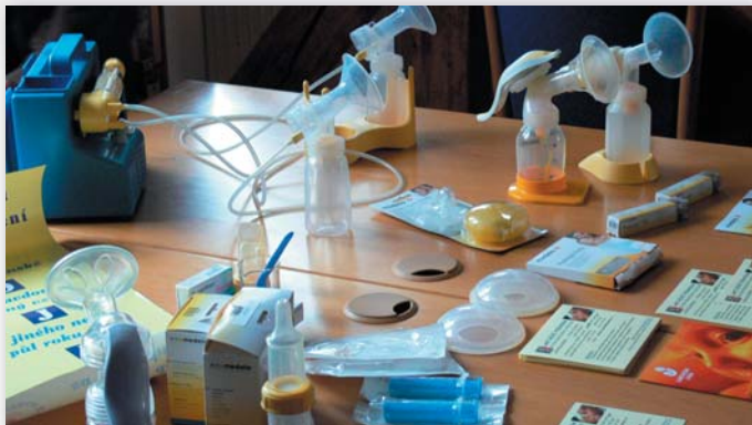
Půjčování a prodej pomůcek ke kojení