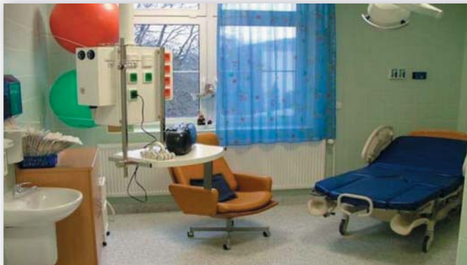
Porodní sál pro alternativní porody

Prohlubujeme spolupráci s perinatologickým a onkologickým centrem FN Ostrava-Poruba.