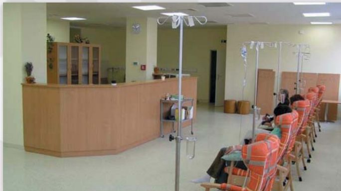
Ambulance pro léčbu bolesti