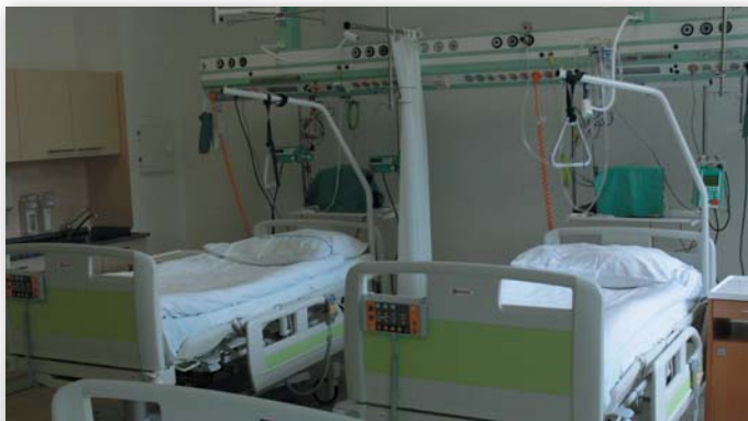
Chirurgie – JIP