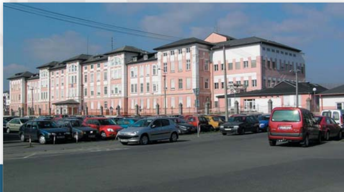
Bezplatné veřejné parkoviště

Vjezd do areálu krnovské nemocnice je povolen pouze vozidlům sanitním, RZP, zásobování a vozidlům na základě povolenek k vjezdu do objektu s parkováním jen na vyhrazených místech. Vjezdy civilních vozidel bez povolenek jsou zpoplatněny – prvních 30 minut zdarma, dále za každou započatou hodinu ve výši 30 Kč. Před vstupním objektem nemocnice se nachází bezplatné veřejné parkoviště s kapacitou cca 90 vozidel.