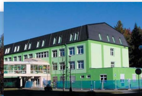
▶ Pavilon s dětským oddělením PO rekonstrukci (10/2010)