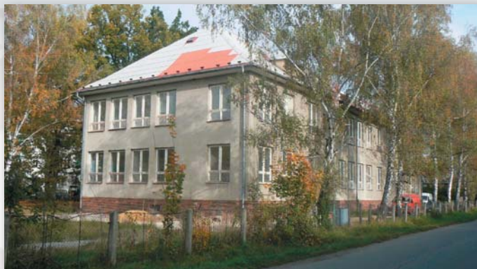
LDN v areálu nemocnice M. Albrechtice