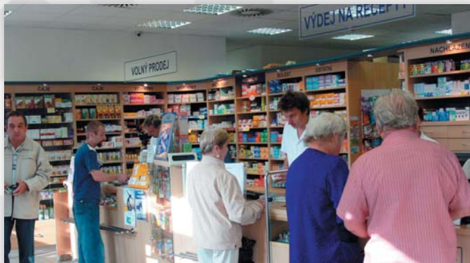
Lékárna pro veřejnost